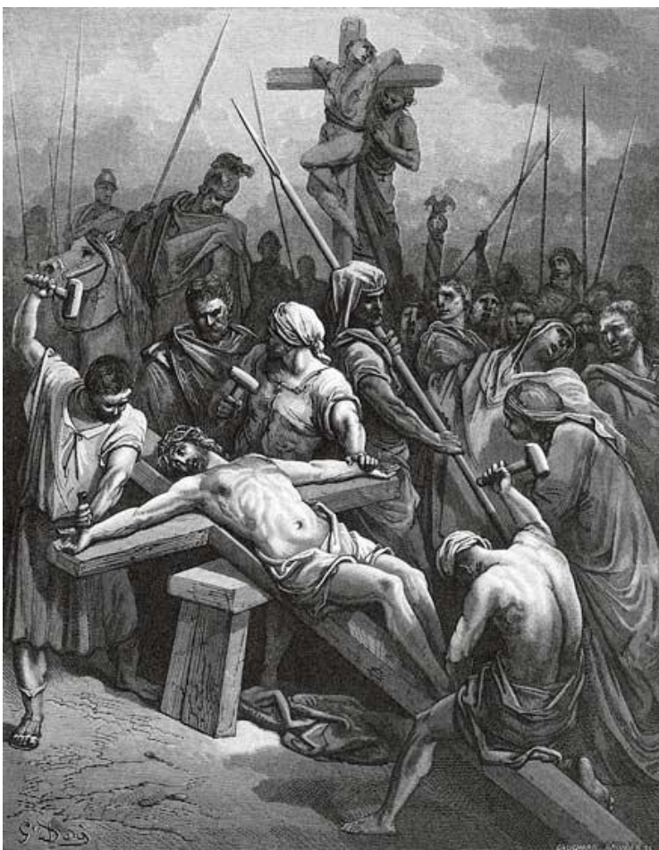
Imagen 1: Cristo resucitado abrazado a la Cruz. Reni, Guido. S XVII. Imagen 2: Crucifixión de Jesús de Nazaret. Gustave Doré. 1866.