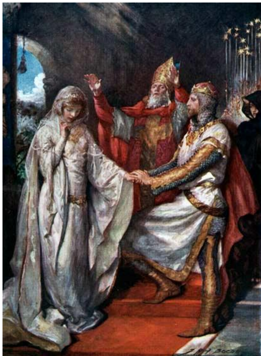
Portada: El matrimonio del rey Arturo y la reina Ginebra. John Henry Frederick Bacon. 1900