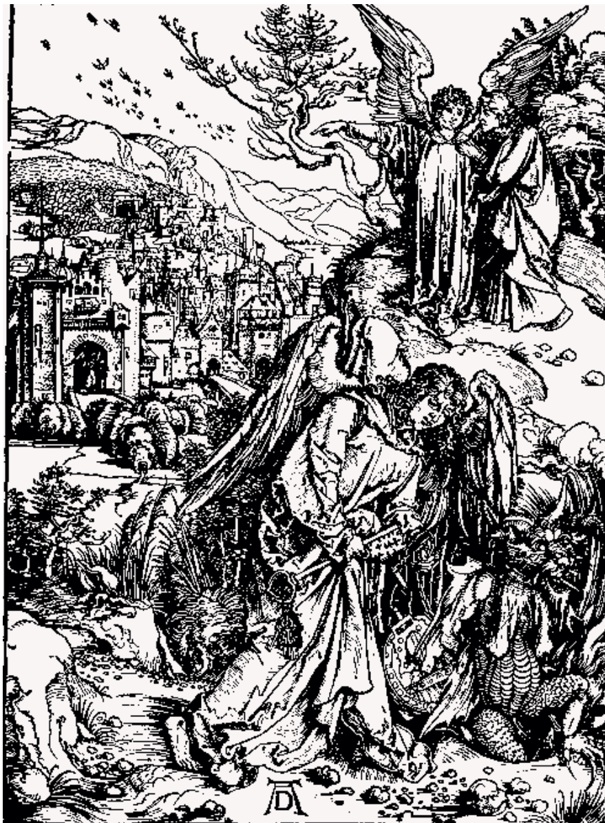
Imagen: Dürer, Albrecht (1471-1528). [La bestia con cuernos de cordero] [Cuatro ángeles detienen los vientos]