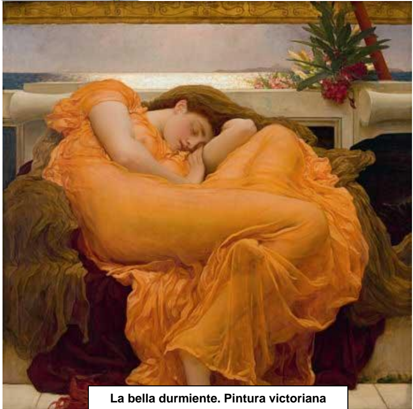
La bella durmiente. Pintura victoriana

Consiste este ejercicio en saber discernir, diferenciar entre lo que es falso y lo que es real, por ejemplo: comprender que este mundo no es como lo vemos, este planeta es multidimensional y debemos verificar por sí mismos que existen siete supra-dimensiones y siete infra-dimensiones, hacia arriba son grados de conciencia despierta y hacia abajo es conciencia embotellada en el ego y que nuestro cuerpo habita en una tercera