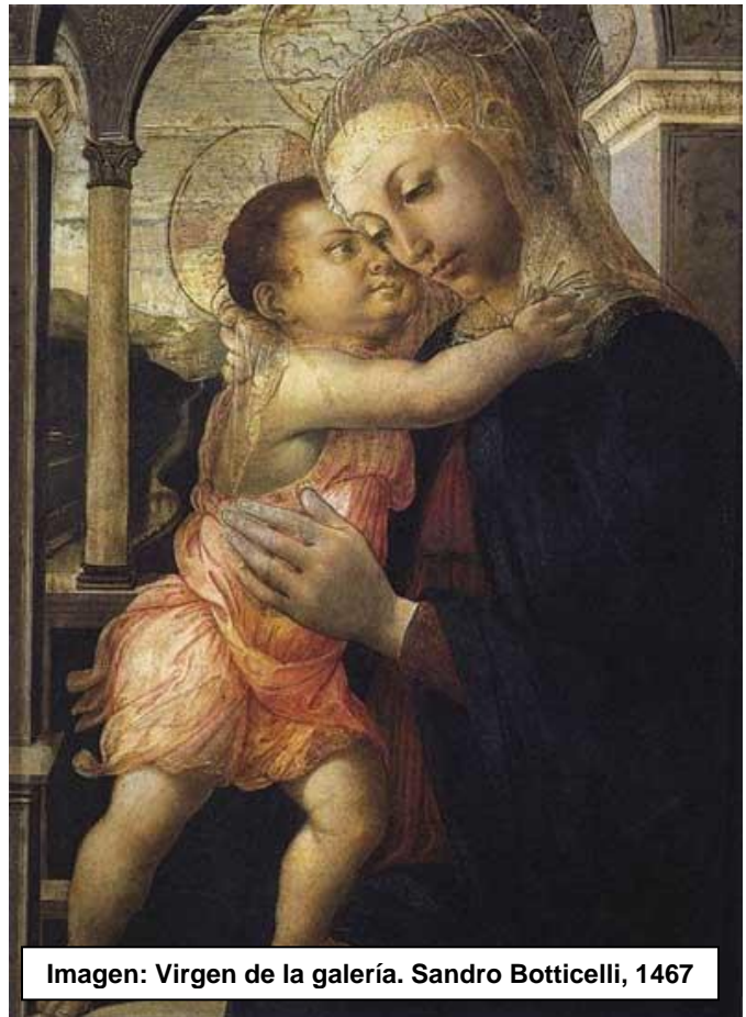
Imagen: Virgen de la galería. Sandro Botticelli, 1467

Pronunciamos esta oración con intensiva fe y devoción miles de veces, cuando ya se sienta en estado de lasitud propia del sueño; al empezar en la mente las primeras imágenes