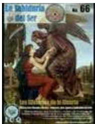
Portada: El Ángel de la Muerte , 1890. Evelyn de Morgan (1855-1919)

Certificado de reserva de Derechos al uso Exclusivo. En el género de: Difusiones periódicas. Especie: Difusión vía red de Cómpu. Titular: Instituto Cultural Quetzalcóatl de Antropología Psicoanalítica, A.C. Título “La Sabiduría del Ser” Reserva: 04-2008-032711425000-203 Dirección de Reservas de Derechos.