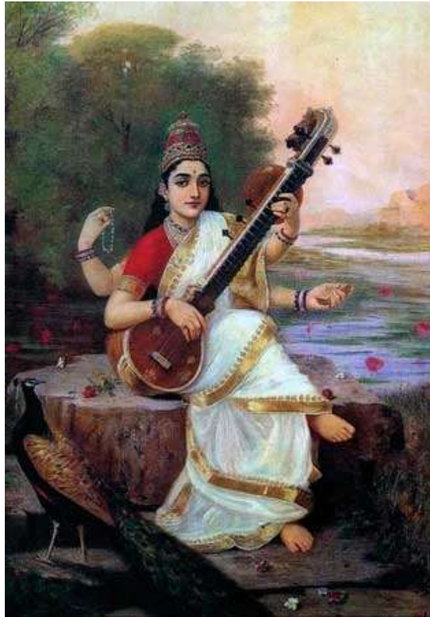
Saraswati por Raja Ravi Varma (1848-1906)

La música clásica es imaginación, inspiración, intuición y voluntad, nos eleva a estados superiores de consciencia, con ella podemos armonizar nuestro cuerpo, impulsarnos en nuestro trabajo interior, es un alimento para nuestra alma.