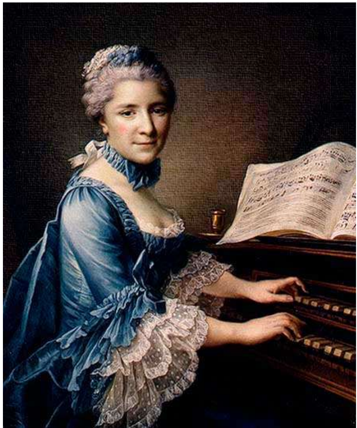
At the piano yactb 13. François-Hubert Drouais. 1727-1775

en aquellas remotas épocas se parlaba un lenguaje universal, se tenían 12 sentidos en lugar de 5. Cuando el hombre degeneró, las siete vocales dejaron de vibrar en el organismo humano al mismo tiempo perdió los siete sentidos que hoy se encuentran latentes y que debemos recuperar haciendo vibrar nuevamente las Siete Vocales de la Naturaleza.