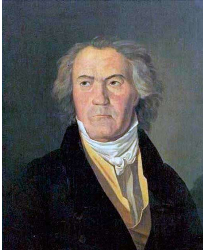
Retrato Beethoven. Ferdinand Georg Waldmüller. 1823

entendemos y comprendemos que la acumulación accidental de objetos no existe. Realmente todos los fenómenos de la Naturaleza y todos los objetos, se hallan íntimamente ligados orgánicamente entre sí, dependiendo internamente unos de otros, y condicionándose entre sí mutuamente. Realmente ningún fenómeno de la naturaleza puede ser comprendido integralmente si lo consideramos aisladamente. Todo está en incesante movimiento, todo cambia, nada está quieto.