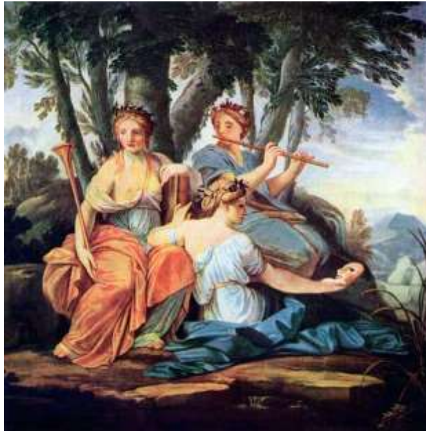
Las musas Clío, Euterpe y Talía, Eustache Le Sueur, h. 1640-1645

Aquel que aprende a pensar en una sola cosa hace maravillas y prodigios.