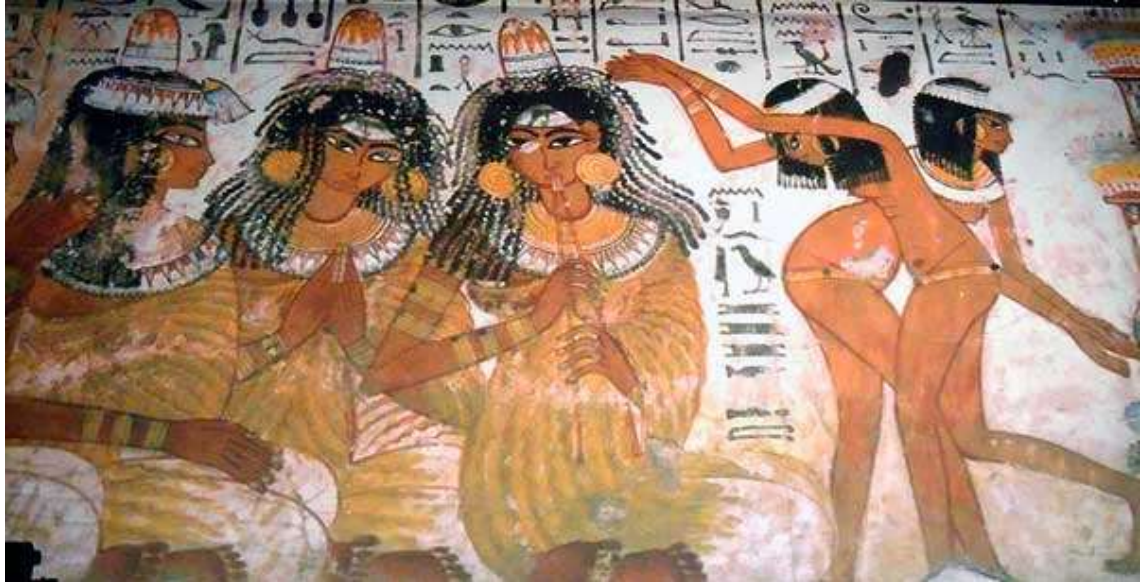
Pintura egipcia con músicos y bailarines.

Iniciados en el verdadero sentido de la palabra, nos han legado grandes enseñanzas gnósticas a través de la música.