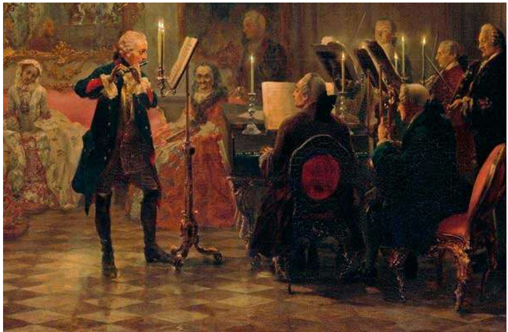
Concierto de Flauta con Federico el Grande en Sanssouci, de Adolph Menzel (1815–1905).

Decían los sabios sacerdotes Nahuas: “Flores y cantos son lo más elevado que hay en la tierra para penetrar en los ámbitos de la verdad”. “El arte es la expresión positiva de la mente, el intelecto es la expresión negativa de la mente. Todos los adeptos han cultivado las bellas artes”. Samael Aun Weor