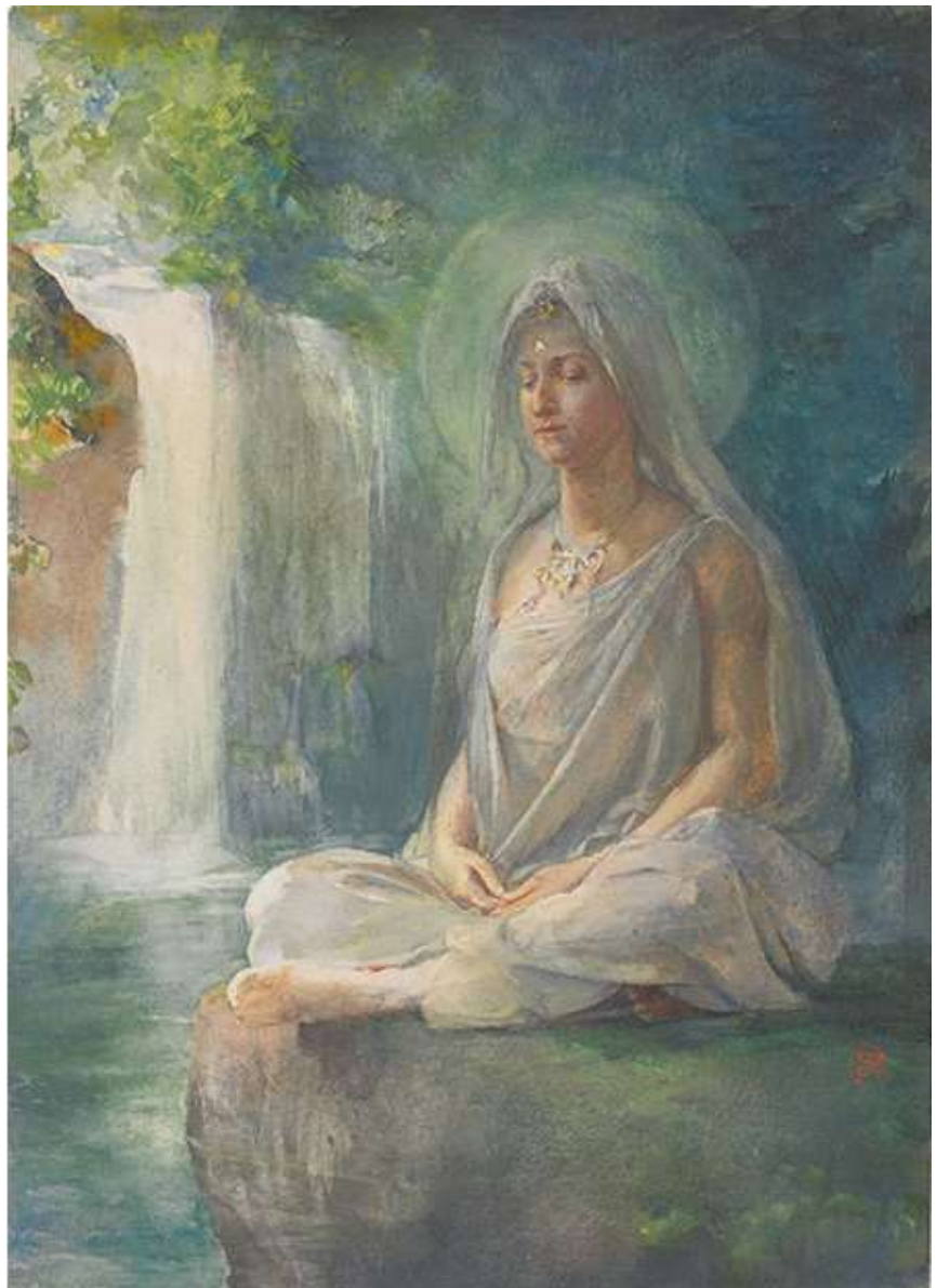
La meditación de Kuwannon. John La Farge. 1800-1811

Dios y sus huestes? En el hacer vibrar nuestro universo humano interior con los mantrams perfectos para su manifestación. Esas palabras de poder que producen un efecto, entregados por tantos maestros como Jesús, gran Kabir, Hermes Trismegisto entre otros y nuestro venerable maestro Samael Aun Weor.