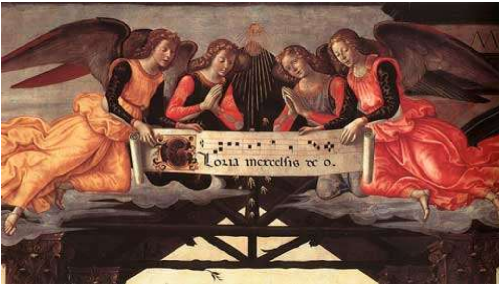
Ángeles cantando. Domenico Bigordi 1449-1494

sucede porque nos identificamos con la situación, es necesario no olvidarnos de nosotros mismos y transformar las impresiones sean de orgullo, vanidad, amor propio o soberbia, entre otras; no dejar que la mente reaccione, interponer la consciencia entre las diversas