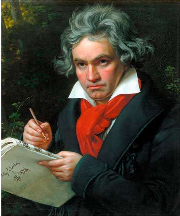
Ludwig Van Beethoven de Joseph Karl Stieler 1820

“Las nueve sinfonías de Beethoven, y muchas otras grandes composiciones clásicas nos elevan a los mundos superiores” Samael Aun Weor