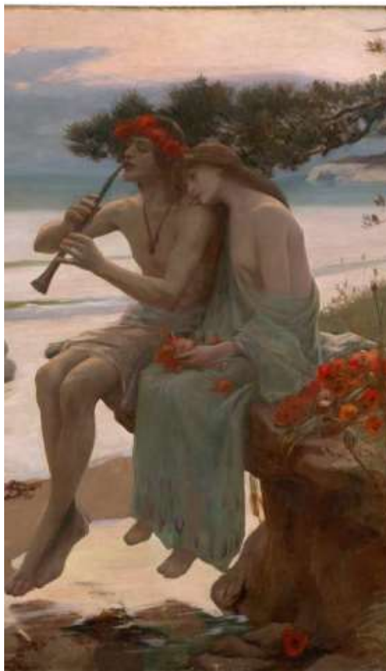
Pastoral. Rupert Bunny. 1893 (detalle)

Fue grandioso este período de nuestra raza Aria porque floreció la sabiduría, todo era armonía y belleza, podían los adeptos lograr la auto-realización íntima del Ser. Actualmente ya no hay la posibilidad de usar los 49 sonidos del AI-ATA-FAN, sin embargo a nivel de principiantes de la Gnosis tenemos un sistema práctico y sencillo para lograr la auto-exploración de los 49 niveles del subconsciente, con el fin de lograr el auto-conocimiento o conocimiento de sí mismo, a través de la meditación podremos conocer la actividad de los