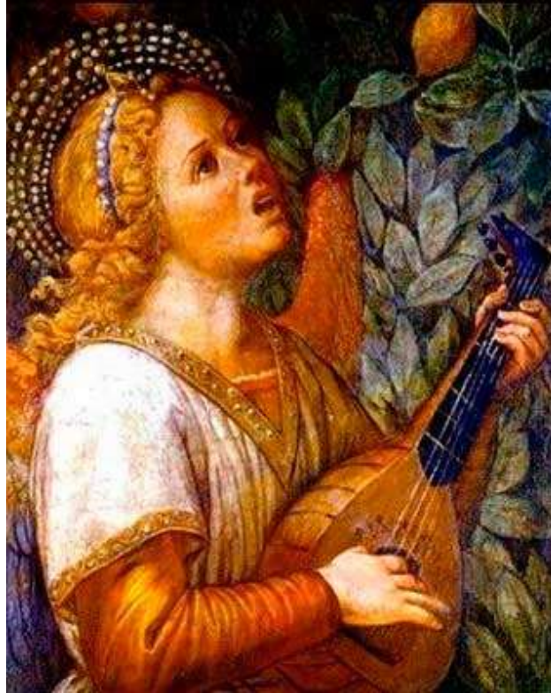
Melozzo da Forlì siglo XV Nombre: Ángel Músico

Estas transformaciones también se verifican de acuerdo a la corriente del sonido, por octavas musicales. La creación del hombre verdadero se realiza de acuerdo con las siete notas: do, re, mi, fa, sol, la si en siete escalas, pues son siete cuerpos los que posee el ser humano y para cada uno se lleva a cabo una transformación, el cuerpo físico, vital, astral, mental, causal, del alma y del ser. Así es