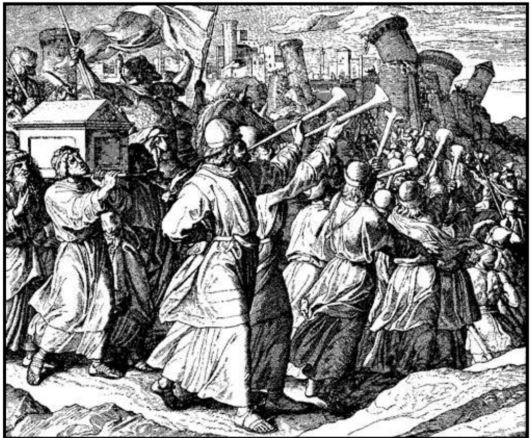
La Batalla de Jericó. Julius Von Carolsfeld. 1794-1872

produce sonido y color, así el átomo considerado la partícula más pequeña está constituido de tres partes primordiales: una parte eléctricamente positiva, formada por los protones ; otra eléctricamente negativa , compuesta por electrones, y una tercera integrada por minúsculas partículas neutras denominadas neutrones, al girar produce sonido, el cual viaja en el espacio-tiempo