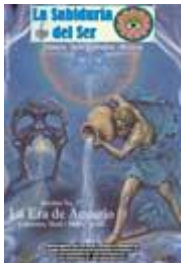
Imagen de portada: Acuaris. Johfra Bosschart.

Certificado de reserva de derechos al uso exclusivo. En el género de: Difusiones periódicas. Especie: Difusión vía red de Cómputo. Titular: Instituto Cultural Quetzalcóatl de Antropología Psicoanalítica, A.C. Título "La Sabiduría del Ser" Reserva: 04-2008-032711425000-203 Dirección de Reservas de Derechos.