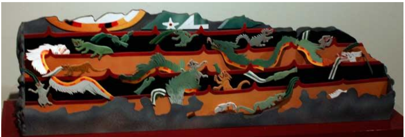
Fragmento de mural: Animales Mitológicos. Teotihuacán México.

Certificado de reserva de derechos al uso exclusivo. En el género de: Difusiones periódicas. Especie: Difusión vía red de Cómputo. Titular: Instituto Cultural Quetzalcóatl de Antropología Psicoanalítica, A.C. Título “La Sabiduría del Ser” Reserva: 04-2008-032711425000-203 Dirección de Reservas de Derechos.