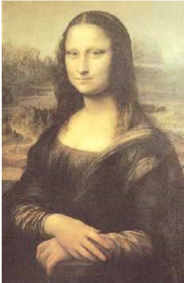
La Gioconda. Símbolo de la Madre Divina