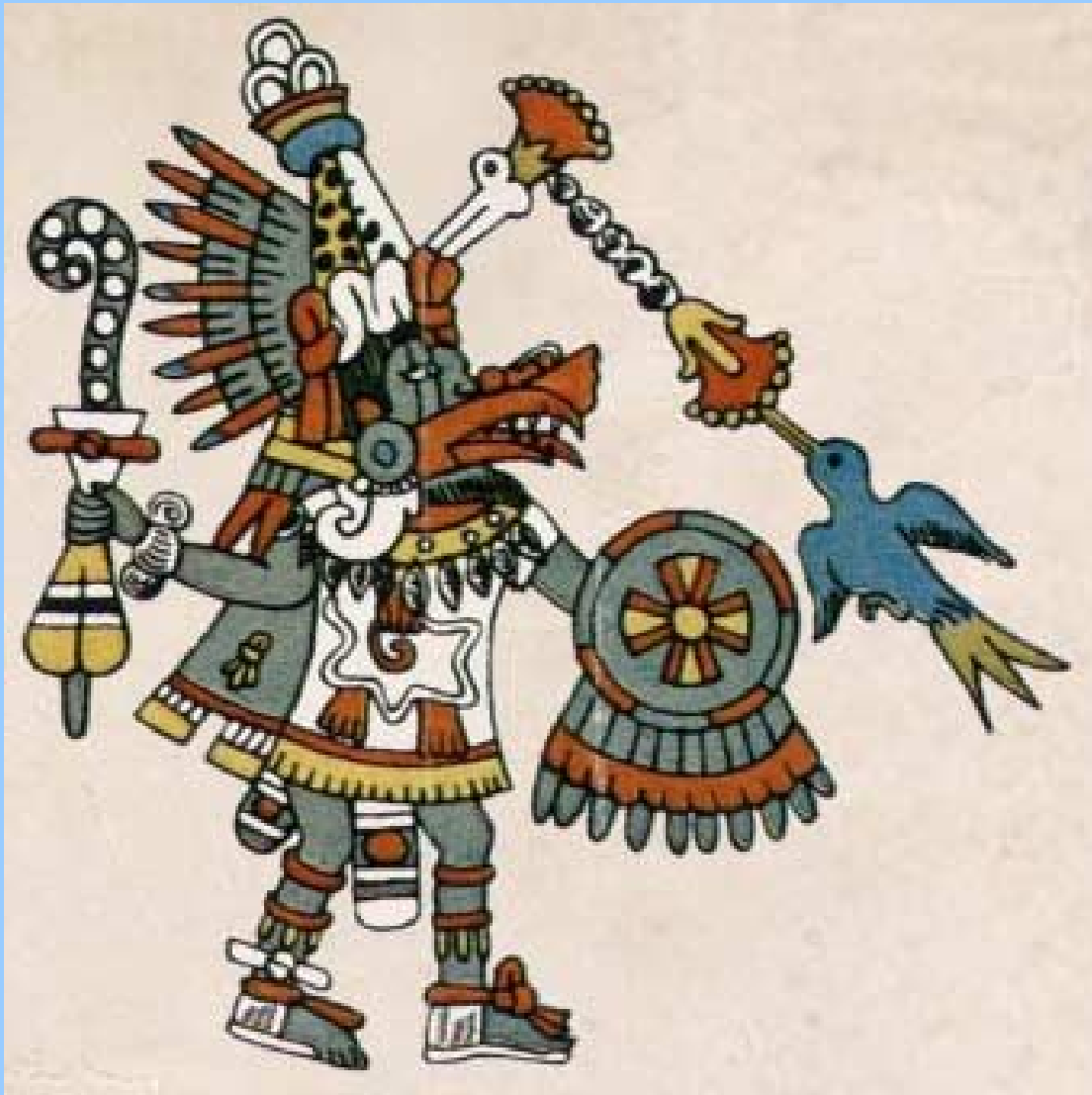
Quetzalcoatl. Serpiente emplumada.

La Sabiduría Oculta dice: "Avivad la Llama del Espíritu con la Fuerza del Amor". La Persuasión tiene más poder que la Violencia. Samael Aun Weor