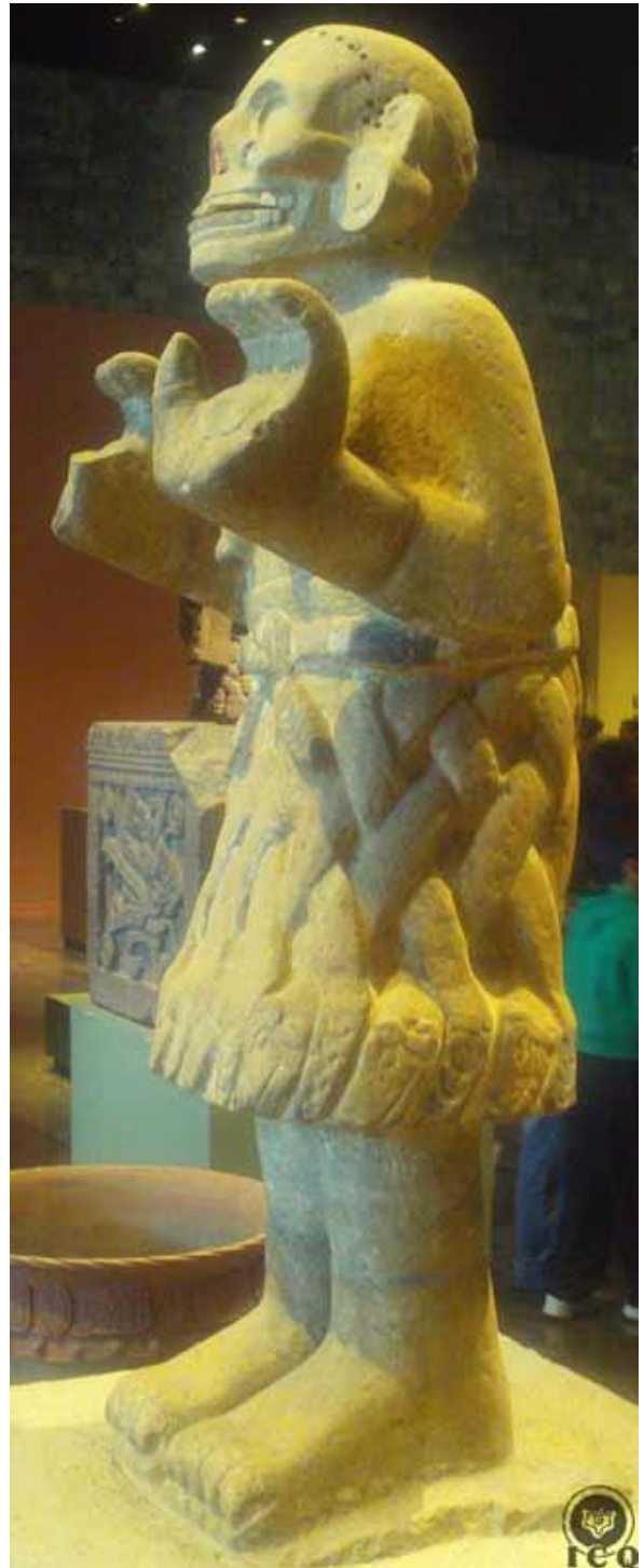
Imagen 1: Representación de Huitzilopochtli en el Códice Tovar. Juan de Tovar. S. XVI. Imagen 2: Representación de Huitzilopochtli en el Códice Telleriano-Remensis. S. XVI. Imagen 3: Coatlicue. Museo Nacional de Antropología.

Para más información véase: “El Nacimiento de Colibrí Zurdo Huitzilopochtli” .