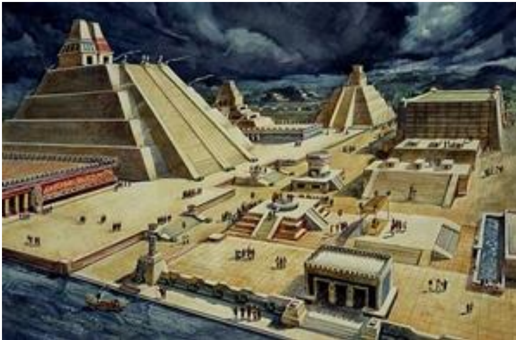
Imagen 1: Fundación de la Ciudad de México. Extracto del códice Durán. S. XVI. Imagen 2: Ometecuhtli y Omecihuatl. Codex Fejérváry-Mayer. Precolombino. Imagen 3: Representación de la posible apariencia de la ciudad de Tenochtitlan anterior a la llegada de los españoles. Diego Rivera. 2013